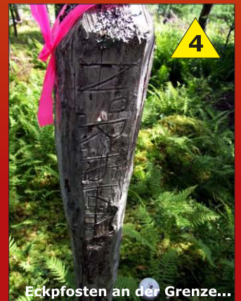
Eckpfosten an der Grenze...